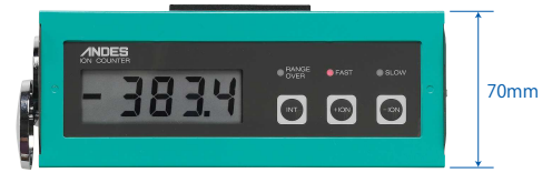
簡単操作、見やすい大型ディスプレイ